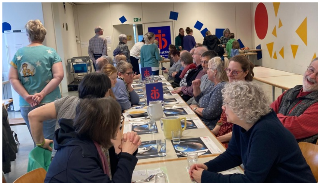
Bild: Fastensuppe Däniken

Das Fasten nicht nur eine religiöse Bedeutung hat, sondern auch Körper und Seele reinigt, ist in unserer Zeit des Überflusses vielen Menschen bewusst. Der Erlös dieser Anlässe geht jeweils an wohltätige Projekte und unterstützt Bedürftige aus aller Welt. Herzlichen Dank an die Organisator:innen und Helfer:innen