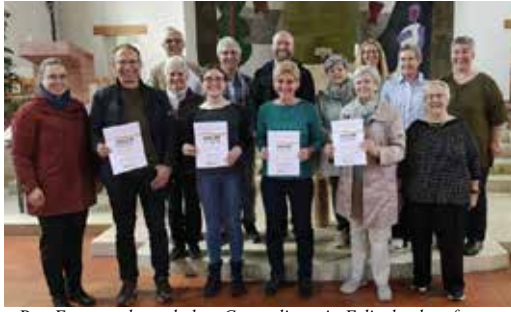
Das Foto wurde nach dem Gottesdienst in Erlinsbach aufgenommen. Drei Teilnehmerinnen sind nicht auf dem Bild zu sehen.

Im November starteten wir einen Kurs in Musiktheorie, da sich herausstellte, dass viele unserer Chorsängerinnen und -sänger nicht in der Lage waren, selbständig Noten zu lesen. Motiviert und neugierig kamen sie für ein paar Samstage, um die Welt hinter den fünf Notenlinien, den schwarzen Punkten und den vielen Zeichen zu entdecken. Wir