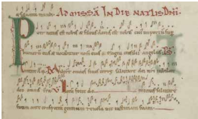
«Puer natus est» Eröffnungsgesang (Introitus) der Weihnachtsmesse, Abtei Saint-Pierre de Corbie, 10. Jh.

Dieses Prinzip funktionierte hervorragend! Der gesamte Liederschatz wurde im ganzen katholischen Abendland auf fast wundersame Weise fast ohne Abweichung und Veränderung über hunderte von Jahren bis in unsere Zeit bewahrt.