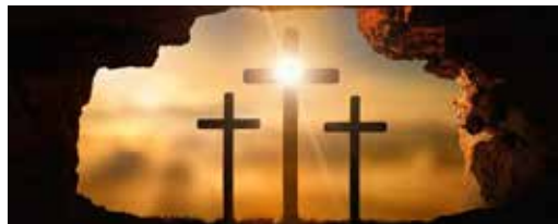
Karfreitag – Gedenken des Leidens und Sterbens Jesu Christi am Kreuz.

Wir wünschen Ihnen wunderschöne Frühlingstage. Seelsorgeteam und Sekretariat