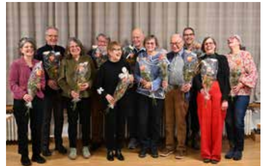
Die für fleissigen Probenbesuch Geehrten