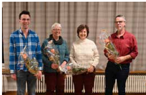
Die neuen Marienchormitglieder