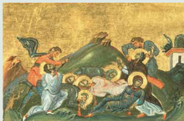
Märtyrerin Perpetua, Märtyrerin Satyrus, Revocatus, Saturnilus, Secundus und Märtyrerin Felicitas. Miniatur aus dem Menologion Basileios II. Konstantinopel, 985. Vatikanische Bibliothek, Rom.

Liturgischer Kalender: Direktorium www.liturgie.ch