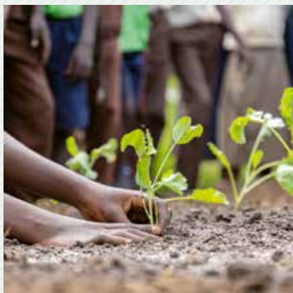
Fastenaktion / HEKS