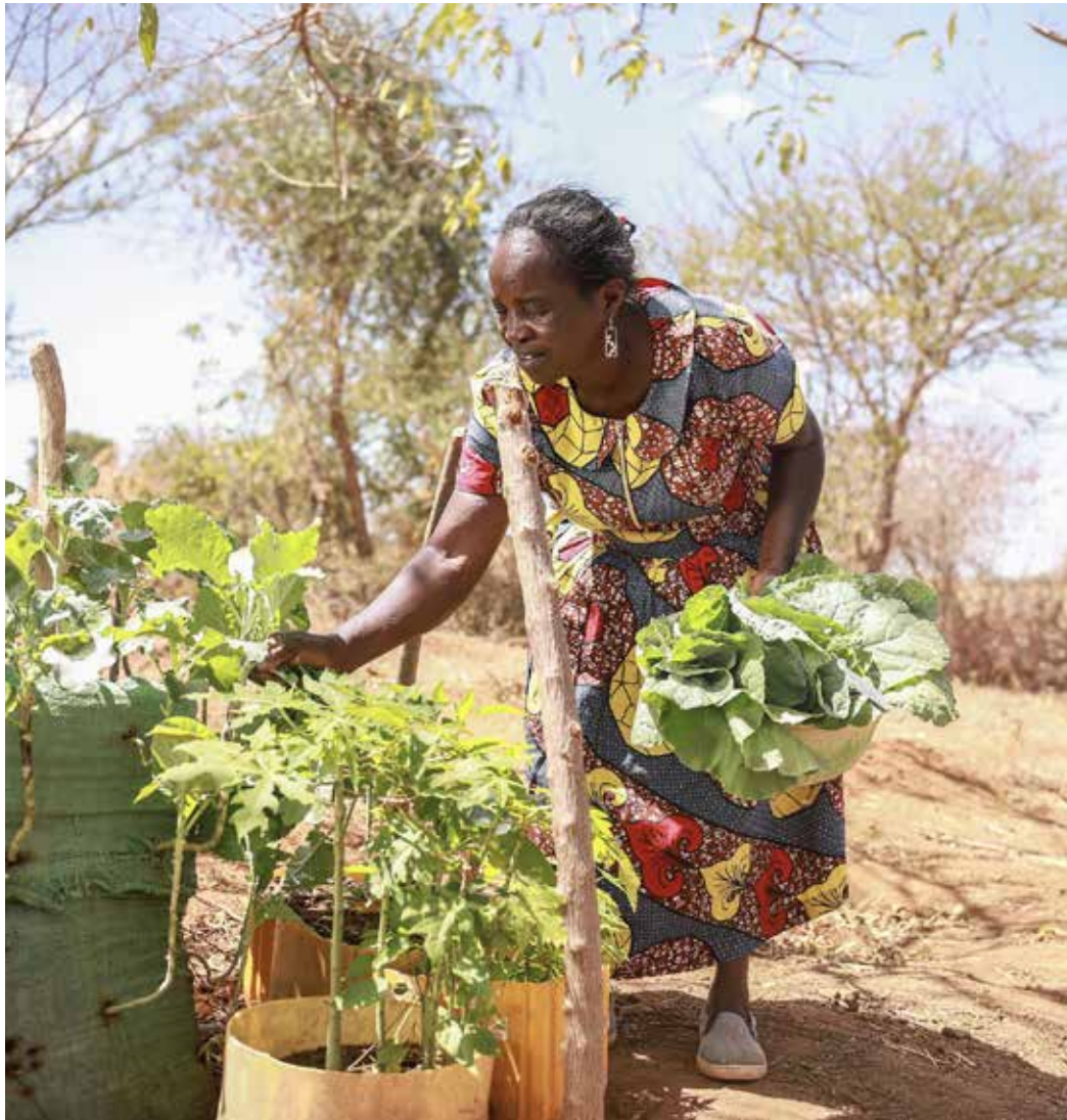
Fastenaktion 2026 «Kenia», die Fastenagenda liegt in den Kirchen auf