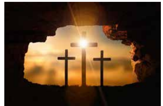
Karfreitag - Gedenken des Leidens und Sterbens Jesu Christi am Kreuz.