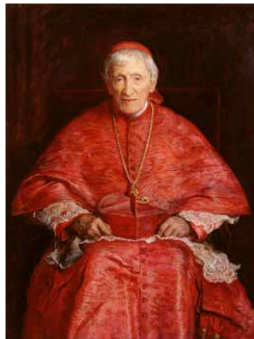
Porträt von John Newman von Sir John Everett Millais, 1881, National Portrait Gallery, London.