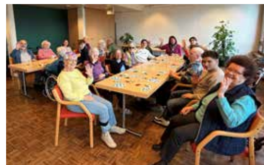
Angel-Force-Aktion 2026: Jugendliche besuchen Seniorinnen und Senioren im Brüggli Dulliken

Jeweils am Mittwochnachmittag oder nach Vereinbarungen finden auch Beratungen an der Schulstrasse 5 in Schönenwerd statt.