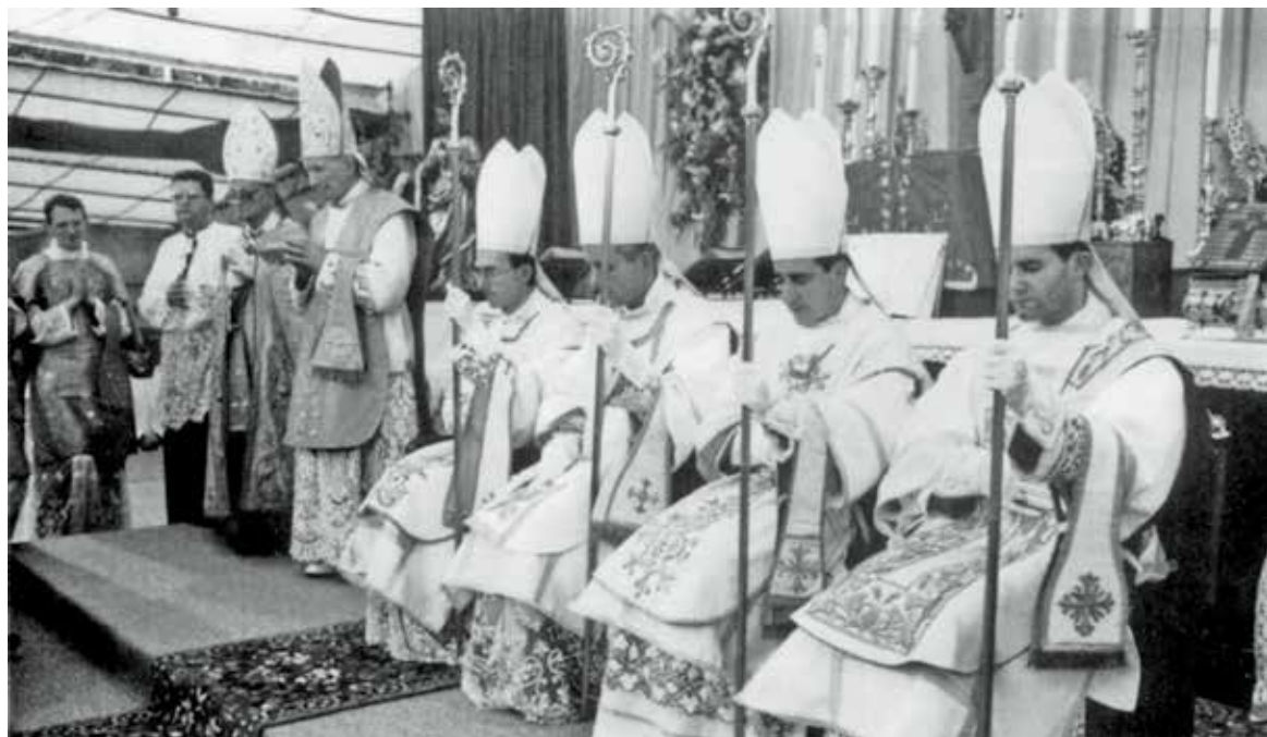
Nicht erlaubte Bischofsweihe von Marcel Lefebvre am 30. Juni 1988 in Ecône.