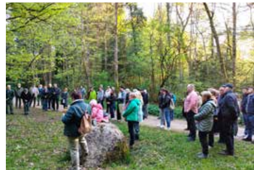
Kreuzweg Däniken 2025

Falls Sie eine Mitfahrgelegenheit von Däniken nach Walterswil suchen, melden Sie sich bitte unter Tel. 078 684 02 50.