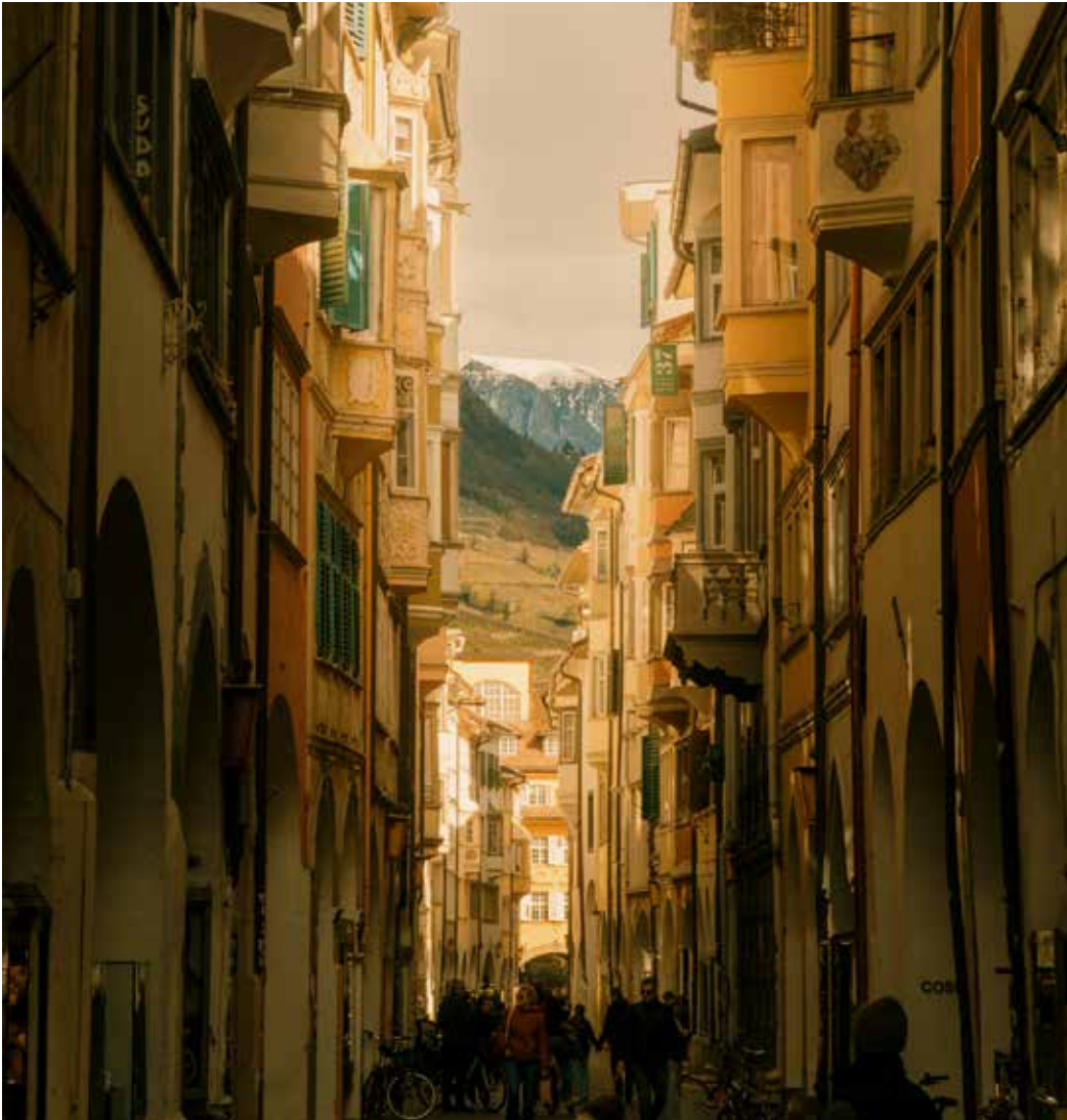
Bozner Lauben, Bozen, Italien