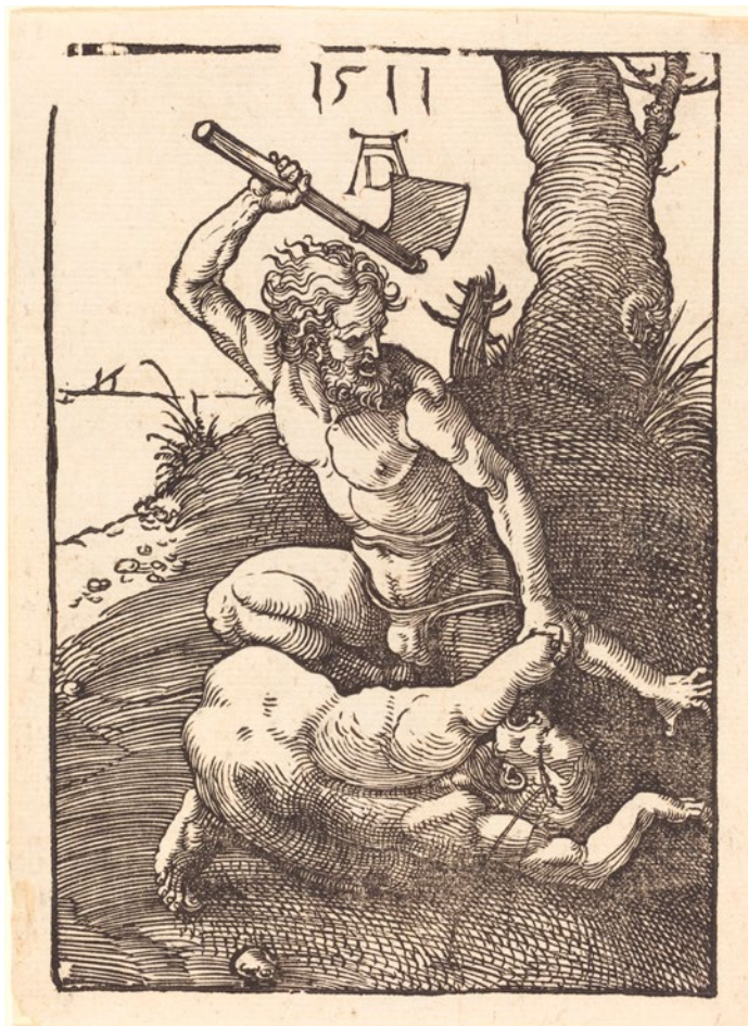
Albrecht Dürer, Kain tötet Abel, 1511, Holzschnitt, Sammlung Rosenwald.

sich als Esau ausgibt. Doch Jakob muss jetzt vor seinem älteren Bruder fliehen. Bei seinem Onkel Laban in Haran dient er sieben Jahre, um dessen jüngere Tochter Rahel heiraten zu können (Genesis 29,16–20). Doch in der Hochzeitsnacht wird nun Jakob selbst Opfer einer Täuschung. Laban gibt ihm die ältere Tochter Lea zur Frau. Sowie die Mutter beim Segen die beiden Söhne vertauscht hat, vertauscht nun der Vater, der Bruder Rebekkas, in der Hochzeitsnacht seine beiden Töchter. Jakob dient weitere sieben Jahre, um auch Rahel, die er eigentlich liebt, heiraten zu können. Die beiden jüngsten Söhne, die Rahel dem Jakob als zwölftes und dreizehntes Kind gebiert, sind dann auch die Lieblingssöhne Jakobs, erst Josef und später Benjamin. Die Bevorzugung des Josef führt zu weiteren Konflikten unter den Brüdern und Josef wird von seinen Brüdern sogar in die Sklaverei verkauft. (Josefsgeschichte in Genesis 37 – 47). Die zwölf Söhne von Jakob mit seinen beiden Frauen und deren Mägden gelten als die Urväter der zwölf Stämme Israels. (Nach der einen Tochter Dina ist allerdings kein Stamm benannt.) Wichtig ist zu erwähnen, dass sich Jakob und Esau am Ende der Erzählung versöhnen (Genesis 33), genauso wie es eine Versöhnung zwischen Josef und seinen Brüdern gibt. (Genesis 45)