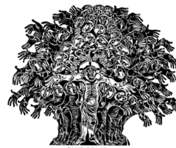
M. Sigmunda May, Das Gleichnis vom Senfkorn. Holzschnitt

Ende Januar startete unser Firmweg. Es haben sich 20 Jugendliche für die Vorbereitung auf die Firmung angemeldet. Im Saal wurden wir mit bunten Fussspuren begrüsst. Das war ein Hinweis darauf, dass wir schon viele Wege gegangen sind und natürlich unser Weg weiter gehen wird. Nach einer Einstimmungsrunde haben wir uns alle nach dem Alter in einer Reihe aufgestellt. In einer Art Fantasiereise – wo wir die Augen geschlossen haben – gingen wir in Gedanken unser Leben von der Geburt bis heute durch. Wichtige Momente und Begegnungen wurden uns bewusst.