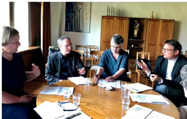
Bischof und Generalvikar am runden Tisch