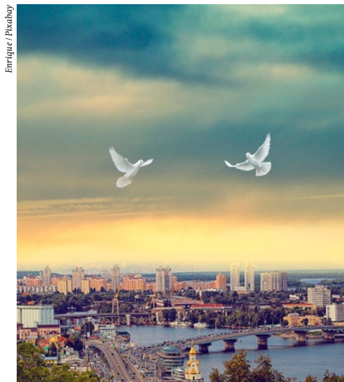
Zwei weisse Tauben über Kiew (Montage).