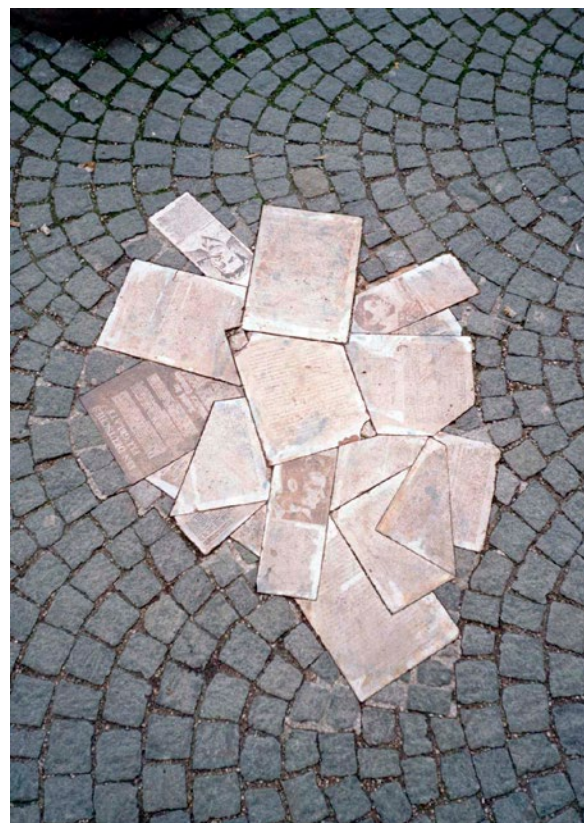
Mahnmal der Geschwister Scholl und für die weisse Rose, vor der Ludwig-Maximilians-Universität, München.

Ab 1943 wurden die Mitglieder der weissen Rose für ihre bekannten Flugblattaktionen verfolgt, verhaftet und zum Tode verurteilt. «Es lebe die Freiheit!» waren die letzten Worte von Hans Scholl vor seiner Hinrichtung im Februar 1943.